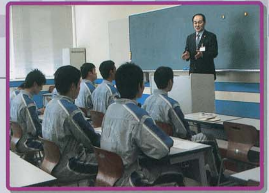
▲企業説明会の様子

また、採用担当者の方からは、真剣に説明を聞き、積極的に質問をされ、一生懸命な学生の姿に好感が持てたとの声がありました。当日、大変お忙しい中にもかかわらず、遠方よりお越しいただきました各社のご担当の皆様にご感謝いたします。