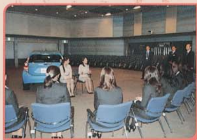
▲ミレルによるロールプレイング