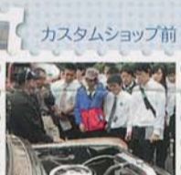
カスタムショップ前