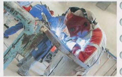
BPコースの実習授業風景