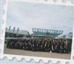
ベンツ、ボルシェの自動車博物館