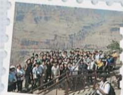
グランドキャニオン

5月に整備科2年生を対象にアメリカ研修が行われました。西海岸コースだけでなく、NASCARを見られる東海岸コースも昨年に続き選択できました。アメリカの文化に触れることで、アメリカ、日本それぞれの車社会の良さを再確認し、視野の広がる良い研修となりました。