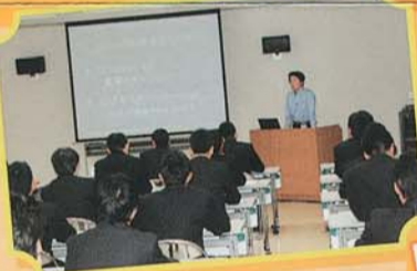
▲86技術講演会の様子

当校にも昨年に86が納車され、オープンキャンパスで試乗会を開催し、大好評でした!!