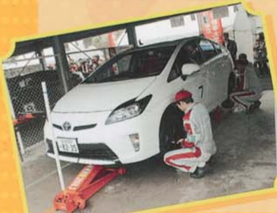
▲サービス競技の様子

12月15日(土)、トヨタ3校対抗プリウスカップを開催しました。初めての試みで学生も先生も緊張した面持ちでしたが、真剣なまなざしで積み重ねた練習の成果をバッチリ発揮していました。結果は、学校対抗、チーム対抗ともに名古屋校が見事総合優勝!!3校ともにハイレベルで白熱した大会となりました。