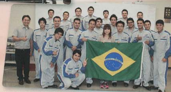
▲ブラジルコース14期生と記念撮影