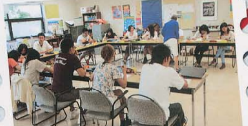
語学コース授業風景