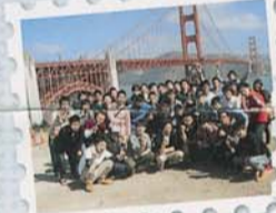
ゴールデンゲートブリッジ