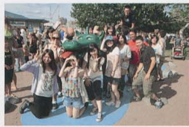
オゴボゴ(オカナガン湖に棲息?する怪物)前