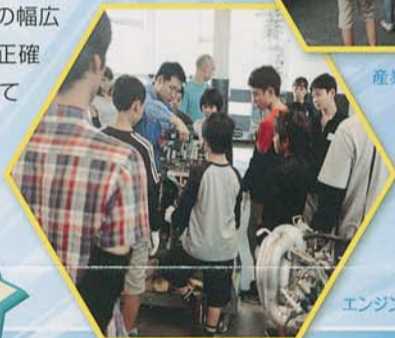
エンジン分解・組み付け体験