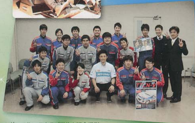
▲ヴィッツレースクラブ学生と記念撮影

将来、一流のメカニックになるために日々目標を持って努力し、成長してほしいものです。