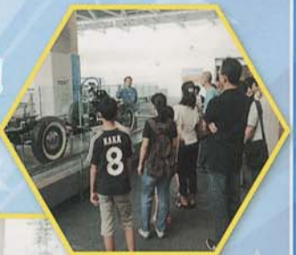
産業技術記念館見学

名古屋市千種区にある「トヨタテクノミュージアム 産業技術記念館」にて「エンジン分解組み付け講座」の講師を当校の職員が務めています。小学校5年生から中学校3年生までの幅広い子供たちを相手に、安全かつ、正確な作業が出来るようにサポートしています。