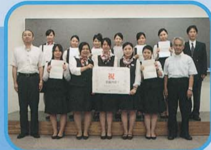
女性ショールームスタッフ科 2年生

両科の2期生が就職活動する時期も近いです。各学生の希望が叶い、全員が内定をいただけるよう頑張っていきます。