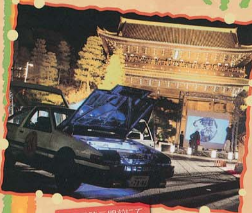
▲知恩院三門前にて

紅葉をバックにライトアップされた知恩院とAE86EV。国宝と電気自動車の時代を超えたコラボは、晩秋の古都に見事に溶け込んでいました。