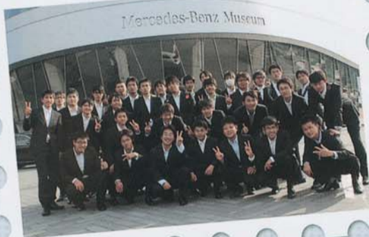
▲メルセデス・ベンツ博物館