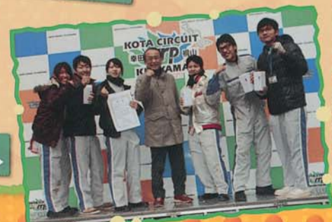
◀前川副社長とともに表彰式の様子▶