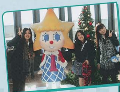
▲東京スカイツリー見学

2013東京モーターショーでは会場の華やかさと人の多さに驚きながらも各ブースを見学。車の魅力や対応の素晴らしさを実感し充実した研修となりました。