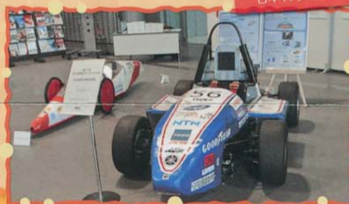
▼お台場日本科学未来館にて

東京モーターショーのイベントの一つ、お台場モーターフェスに学生フォーミュラ車両を展示してきました。子供対象に運転席に乗ってもらいましたが、乗った子供たちはハンドルを握りうれしそうにしました。