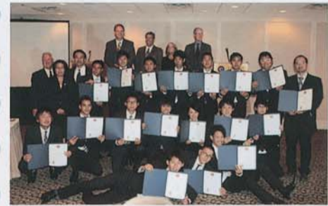
▲オカナガン大学修了式