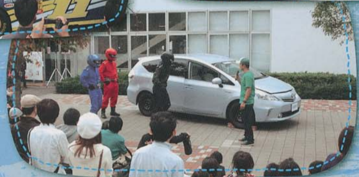
▲整備の味方 ナオスンジャー実演