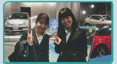
▲アムラックス東京

東京スカイツリーは晴天に恵まれ、世界遺産富士山もバッチリ見え絶景に感動、ソラマチも堪能しました。