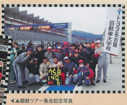
◀◀観戦ツアー集合記念写真