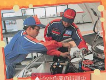
▲ピット作業の特訓中

現地メカニックスクールNASCAR TECHNICAL INSTITUTEでレース参戦に向け体験授業受講。レース当日はピットクルーのライセンスが発給され、緊張感でいっぱいの中テストを無事終了、車検も見事にパスしピットクルーとしての役割を見事果たしました。