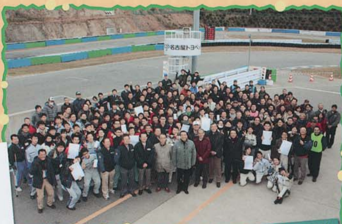
▲幸田サーキット YRP桐山

12月15日(日)、愛知県の幸田サーキットで3校プリウスカップにメカニックとして参加しました。やるからには勝ちたい!! その気持ちがなければ出場できなかったと思います。結果は優勝カップを取り戻すことはできませんでしたが、得るものは大きかったです。目標に向かって仲間と走り続ける経験したことなど、就職後に活かしたいと思います。