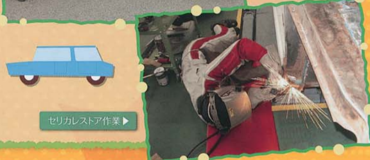
◀セリカレストア作業▶