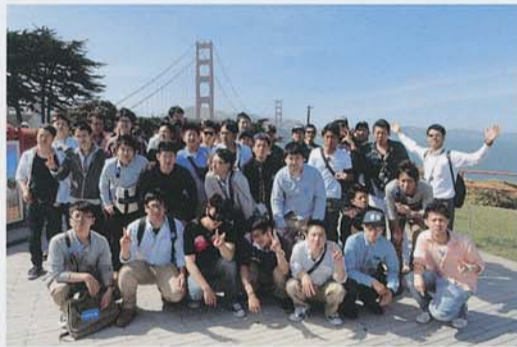
▲サンフランシスコ ゴールデンゲートブリッジ