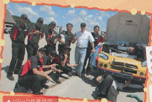
▲パドック作業見学