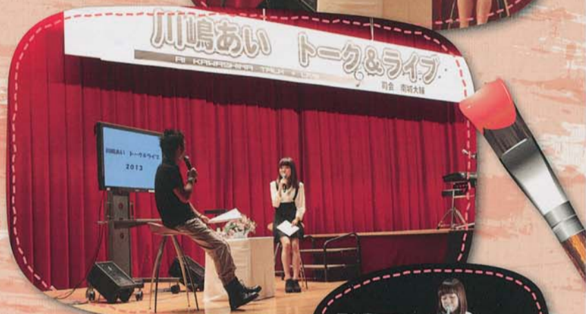
川嶋あいさんのトーク&ライブ▲▶