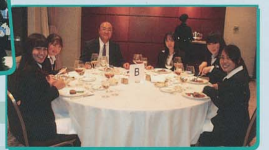
▶ハイアットリージェンシー東京にてテーブルマナー

2013東京モーターショーでは会場の華やかさと人の多さに驚きながらも各ブースを見学。車の魅力や対応の素晴らしさを実感し充実した研修となりました。