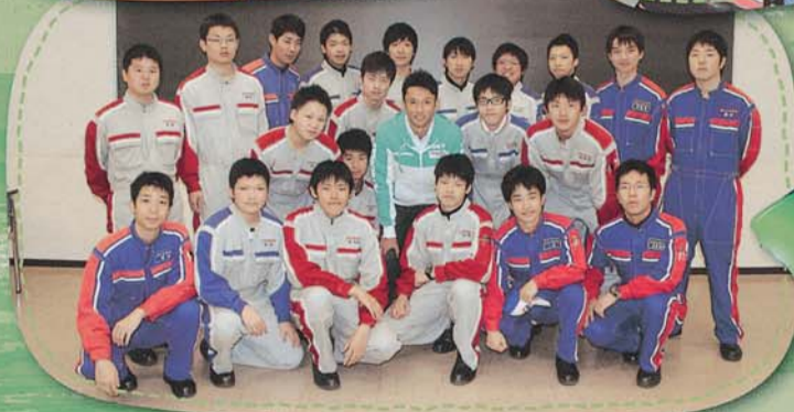
▲ウィッツレースクラブ学生と記念撮影

シミュレーターでレース対戦を実施した後は、WEC応援ツアーに参加した学生と「レースマシンについて」の懇談会とサイン会を実施し、憧れの選手と会話しながら一生の思い出を作りました。