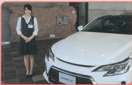
▲女性ショールームスタッフ科

学生からは「車の知識が浅く、もっと車の勉強をしなければいけないと痛感した。」「作業はとても緊張するが、やりがいがありよかった。」「お客様と直接お話する機会があり、楽しかった」などの感想がありました。また、販売会社様からは「積極的に質問があり、入社を楽しみにしています」などのお言葉をいただきました。この経験を生かし、来春4月には全国のフロントラインで学生が活躍することを期待しています。