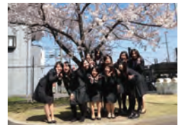
桜の下で、はいチーズ!

A. 学校で学ぶ2年間はあっという間ですが、日々の授業を楽しみながら、一つ一つをしっかり覚えて、自分の糧にして欲しいと思います。学校で習ったことは仕事現場できっと役に立ちます。