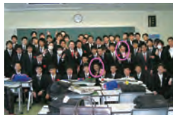
教室でクラスメートと集合写真